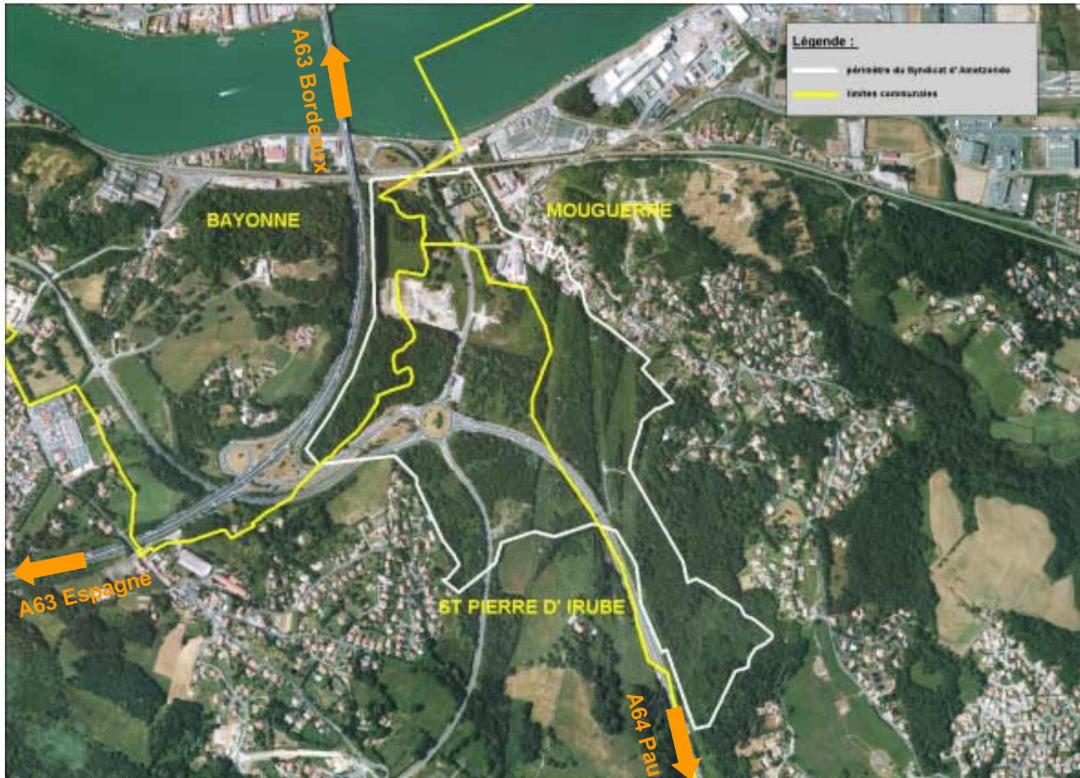
Le site d'Ametzondo