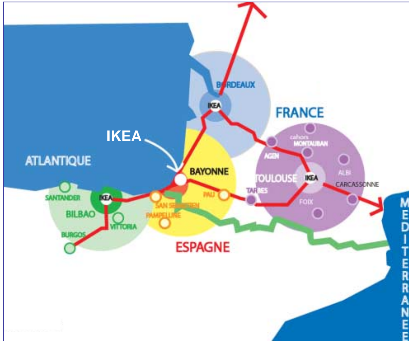
Zone de chalandise